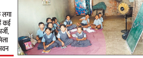
प्रधान पाठक लगा चुके हैं कई बार अर्जी, नहीं मिला नया भवन

कटेली। बरमकेला के ग्राम पंचायत नावापापा के आश्रित ग्राम अमलीपाली के डीपापा प्रायमरी स्कूल भवन पूरी तरह जर्जर हो चुका है। छत से पानी टपकता है दीवारों में दरारें पड़ गई हैं और प्लास्टर टुकड़ों में गिर रहा है। बरसात के दिनों में बच्चों को कक्षाओं में बैठाना खतरने से खाली नहीं है।