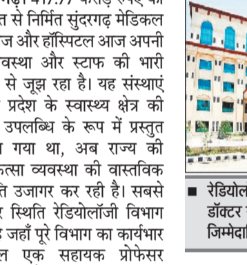
रेडियोलॉजी विभाग में केवल एक डॉक्टर संभाल रहे तीन जिम्मेदारियां

सुंदरगढ़। 417.77 करोड़ रुपए की लागत से निर्मित सुंदरगढ़ मेडिकल कॉलेज और हॉस्पिटल आज अपनी अव्यवस्था और स्टाफ की भारी कमी से जूझ रहा है। यह संस्थाएं जिसे प्रदेश के स्वास्थ्य क्षेत्र की बड़ी उपलब्धि के रूप में प्रस्तुत किया गया था, अब राज्य की चिकित्सा व्यवस्था की वास्तविक स्थिति उजागर कर रही है। सबसे गंभीर स्थिति रेडियोलॉजी विभाग की है जहाँ पूरे विभाग का कार्यभार केवल एक सहायक प्रोफेसर संभाल रहे हैं। डॉक्टर मेडिकल छात्रों को पढ़ाते हैं, एक्स रे करते हैं और सप्ताह में केवल एक दिन एमआरआई की सुविधा प्रदान करते हैं। इस कारण गंभीर मरीजों को समय पर जांच नहीं मिल पा रही है और उन्हें संबलपुर, बुरला या राउरकेला तक जाना पड़ता है, जिससे आर्थिक बोझ और मानसिक